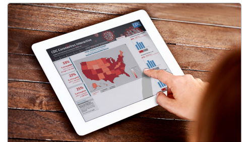
Bản đồ tương tác về vi-rút corona

**Tổng số khu vực phân quyền bao gồm 50 tiểu bang, Thủ Đô Washington, Đảo Guam, Quần đảo Bắc Mariana, Puerto Rico và Quần đảo Virgin thuộc Hoa Kỳ.