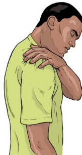
Maumivu ya viungo na muscles