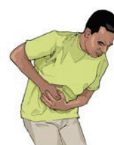
Dores no estômago