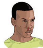
Hemorragias ou hematomas sem explicação

Dirija-se imediatamente a uma Unidade de Tratamento do Ébola.