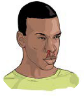
Sangrado o moretones sin causa aparente

Vaya a una unidad de tratamiento de la enfermedad del Ébola ahora.