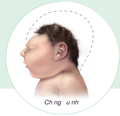
Chứng đầu nhỏ

Nhiễm vi rút Zika trong thời gian mang thai có thể là nguyên nhân làm cho thai nhi bị dị tật bẩm sinh ở não, được gọi là chứng đầu nhỏ. Các vấn đề khác đã được phát hiện ở thai nhi và trẻ sơ sinh bị nhiễm vi rút Zika trước khi sinh, chẳng hạn như các khuyết tật ở mắt, khuyết tật thính giác và suy giảm phát triển. Hiện đã gia tăng các báo cáo về hội chứng Guillain-Barré, bệnh không phổ biến về hệ thần kinh tại các vùng bị ảnh hưởng của vi rút Zika.