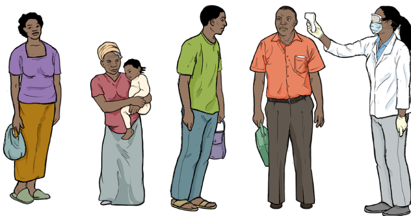
Aguarde enquanto medimos a sua temperatura.