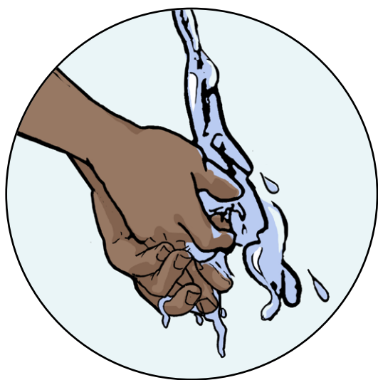
Lave as mãos.

É obrigatório lavar as mãos e submeter-se a rastreamento