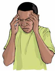
Dores de cabeça