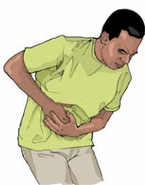
Dores no estômago