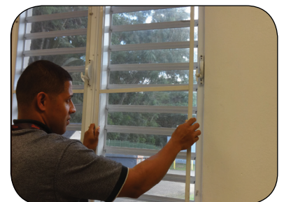
安裝或修補紗窗和紗門。