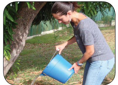
排空和倒空任何積水。