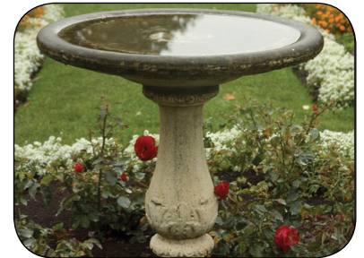
每週清空噴泉或觀鳥水盆的積水。