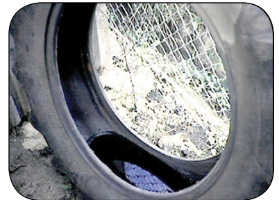
將舊輪胎回收，或防止遭到雨水侵蝕。