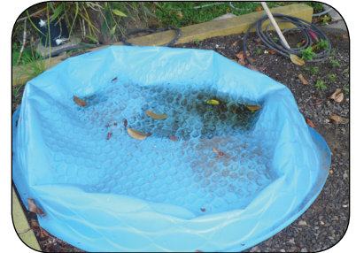
小水池不用時要將水放掉。