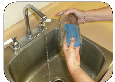
每週刷洗瓶罐和容器以清除蚊蟲卵。