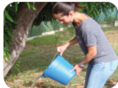
Alisan ng tubig & itapon ang anumang hindi umaagos na tubig.