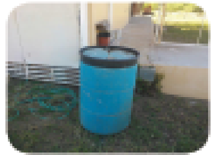
Panatilihin nakatakip ng wasto ang mga lalagyan ng tubig.