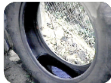
Gamiting muli ang mga lumang gulong o panatiliing protektado ang mga ito mula sa ulan, hindi ginagamit.