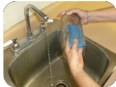
Kuskusin ang mga plorera & lalagyan minsan sa isang linggo upang maalis ang mga itlog ng lamok.