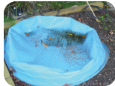
Alisan ng tubig ang mga pool kung hindi ginagamit.