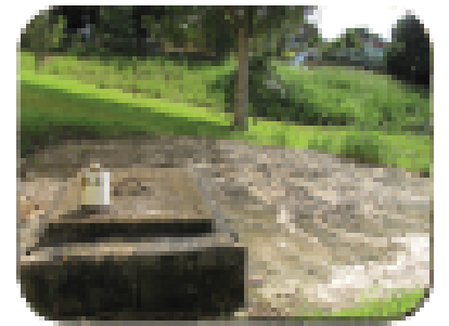
Panatilihin ang mga alkantarilya na nakasara.