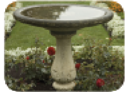
Lingguhang, alisin ang naka-tigil na tubig sa mga fountain at bird bath.