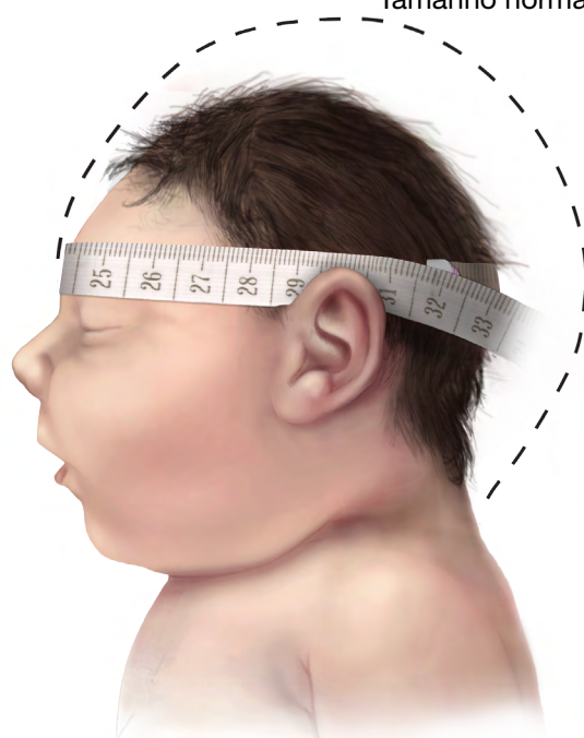
Bebê com microcefalia