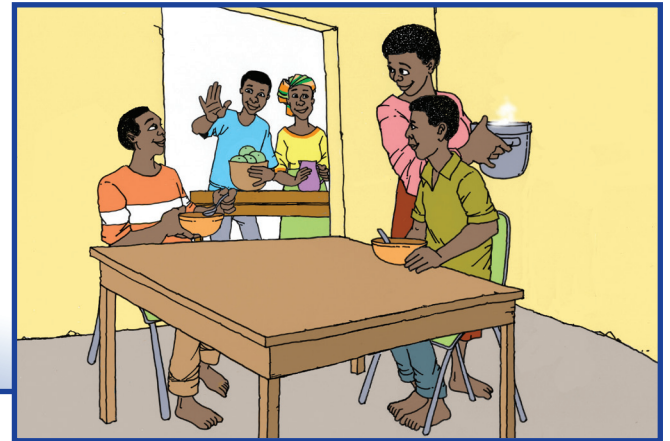
Ep yu neba den