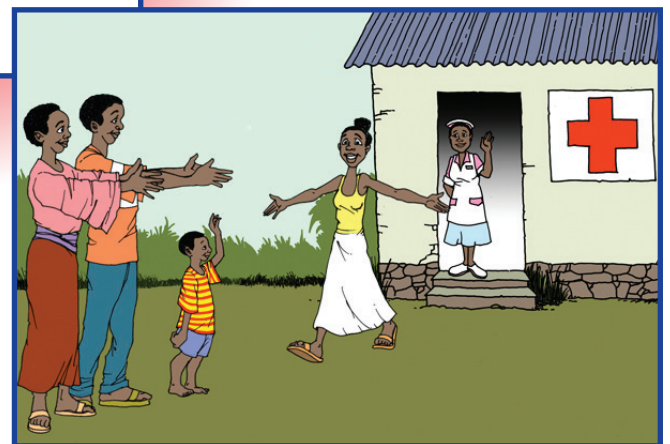
Wen wi ep wisef, wi go sev layf! So mek wi ep wisef fə fet Ebola!