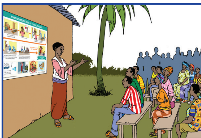
Ep yu Komuniti