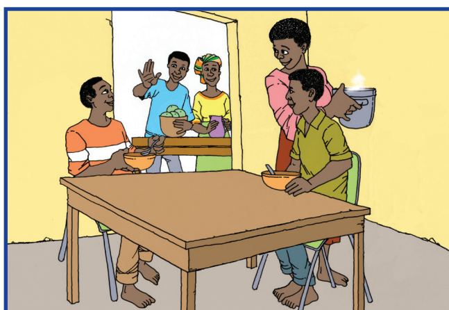
Ep yu neba den