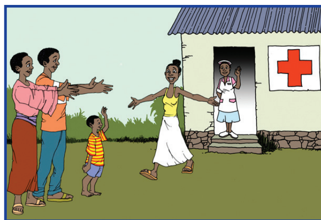
Wen wi ep wisef, wi go sev layf! So mek wi ep wisef fo fet Ebola!