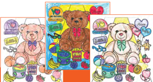
Participaciones ganadoras del concurso infantil de dibujo