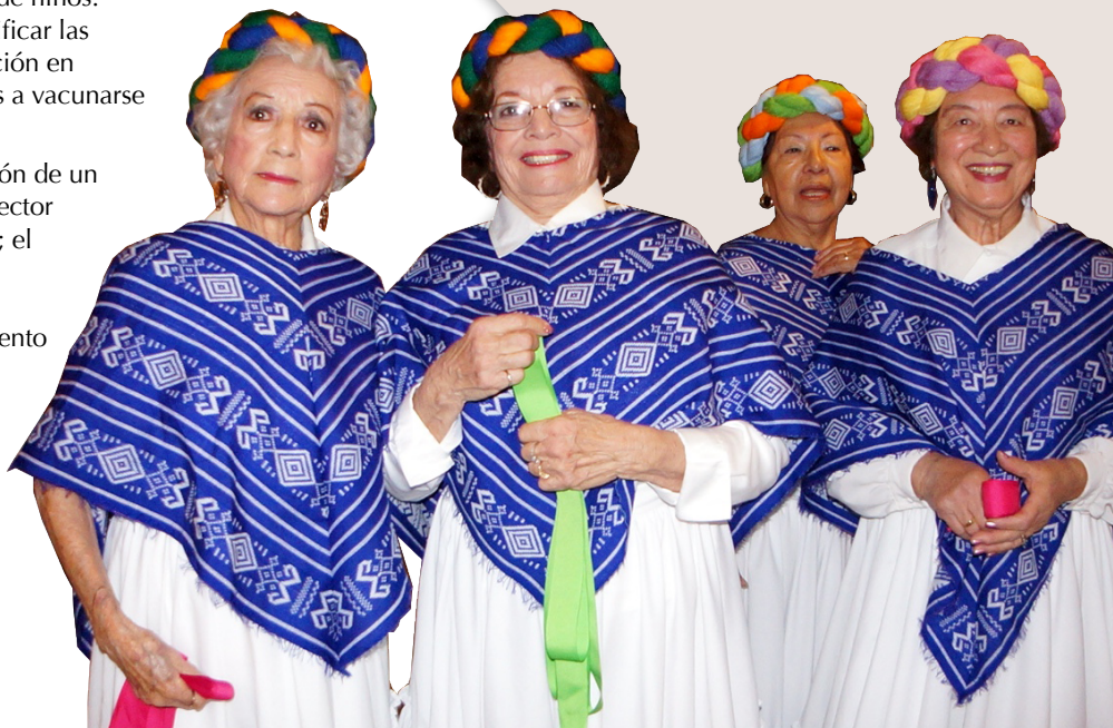
Celebración de la Virgen de Guadalupe en la Iglesia Resurrección en el Este de Los Ángeles