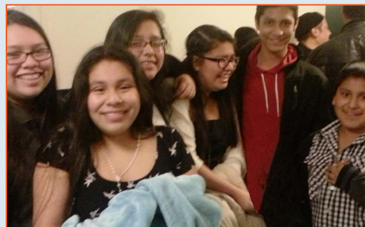
Jóvenes feligreses hacen fila para vacunarse.

El 12 de diciembre de 2014, más de 600 personas asistieron a las fiestas organizadas por la iglesia católica y escuela parroquial Christ the King , donde también se promocionó la vacunación contra la influenza. Fundada en 1949, la Iglesia sigue siendo un pilar de la comunidad, proporcionando actividades para fomentar el bienestar de sus diversos miembros. Este año la escuela patrocinó un concurso de colorear para niños sobre el tema "Yo Me Vacuno". Un panel de líderes comunitarios, incluyendo a Justin Coyle de Walgreens, se ofrecieron como voluntarios para ser los jueces del concurso. Al inicio de la tarde, la mascota de los Seattle Mariners , Moose, se presentó para felicitar a los ganadores, entregar premios especiales y compartir gratos momentos con los niños y padres.