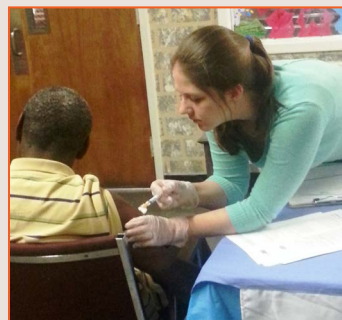
Hombre indigente recibiendo vacunación en la iglesia Church of the Reconciler en Birmingham, AL

El 7 de diciembre de 2014, la Concejal del Distrito 6 de Birmingham, Sheila Tyson y el socio de la NIVDP, Friends of the West End , organizaron una clínica de vacunación para los indigentes. La clínica inició su trabajo después del servicio religioso de la Church of the Reconciler en Birmingham, Alabama.