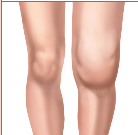
Joelho com artrite.