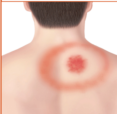
Erupção cutânea tipo "olho-de-boi" nas costas