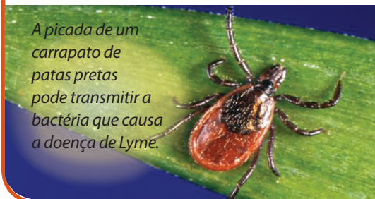
A picada de um carrapato de patas pretas pode transmitir a bactéria que causa a doença de Lyme.