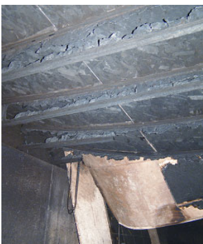
Figura 3. Vigas doble T dañadas por el fuego desde donde cayeron las víctimas. Observe cómo el alma vertical está casi completamente consumido [NIOSH 2006a].

Los bomberos que trabajan en pisos dañados por un incendio, sin importar la clase de estructura, se han caído desde los pisos debilitados y han quedado atrapados en fuego de los niveles inferiores [NIOSH 2005]. Son similares los peligros que enfrentan los bomberos que trabajan bajo sistemas de pisos dañados por el incendio debido a que pueden venirse abajo y caer encima de ellos. El siguiente es un estudio de caso de NIOSH en un sistema de pisos de madera procesada y sin protección. El piso debilitado no se podía detectar desde encima, aunque las condiciones de afuera indicaban la posibilidad de que el incendio provenía del sótano.