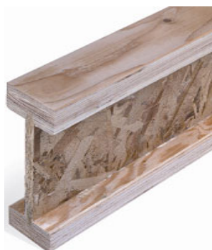
Figure 1. Viga de madera procesada doble T.

Los bomberos corren el riesgo de caerse de los pisos dañados por el fuego. Los pisos pueden derrumbarse minutos después de haber entrado en contacto con las llamas. La alfombra, las baldosas de cerámica, el concreto liviano y las cubiertas similares de pisos pueden aumentar el peligro para los bomberos debido al peso extra que tiene que aguantar el sistema del piso y al aislamiento que estos materiales proporcionan, haciendo que el piso no se sienta caliente a pesar de que haya fuego por debajo.