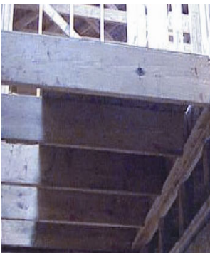
Figura 2. Vigas de pisos tradicionales.

La viga de madera procesada doble T tiene un perfil diferente que la viga de madera tradicional o aserrada ( estándar véase figura 2) y en las pruebas, ardió más rápidamente. Como ocurre típicamente, la parte fina del cuerpo de la madera se consumió primero (véase figura 3). Varios grupos llevaron a cabo pruebas para deducir el tiempo en que la madera tarda en deteriorarse, los más recientes fueron de Underwriters Laboratories (UL) [2008]; [Strasleske and Weber 1988; Weyerhaeuser 1986]. Las pruebas UL muestran que el montaje de las vigas livianas prefabricadas (doble T) no protegidas puede deteriorarse en solo 6 minutos, y que el de las residenciales de construcción tradicional no protegidas se deteriora en menos de 19 minutos. Estudios anteriores en los que se usaron métodos de prueba diferentes indican tiempos más cortos de deterioro. Los resultados de estos estudios también demuestran que cualquier sistema de piso puede derrumbarse rápidamente y que las vigas doble T de madera procesada sin protección pueden deteriorarse en menos tiempo. Los resultados de los experimentos (en inglés) llevados a cabo por el National Institute for Standards and Technology (NIST) se esperan para la primavera del 2009 y estarán disponibles en www.fire.gov . Los experimentos de NIST se realizaron en condiciones limitadas de ventilación para representar un incendio real en un sótano.