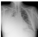
Radiografía de tórax que muestra un mesotelioma severo (en blanco)

Esta enfermedad puede tardar muchos años en manifestarse. Miles de trabajadores de la construcción han muerto por haber respirado asbesto y otros miles más están en riesgo. Usted podría estar en riesgo.