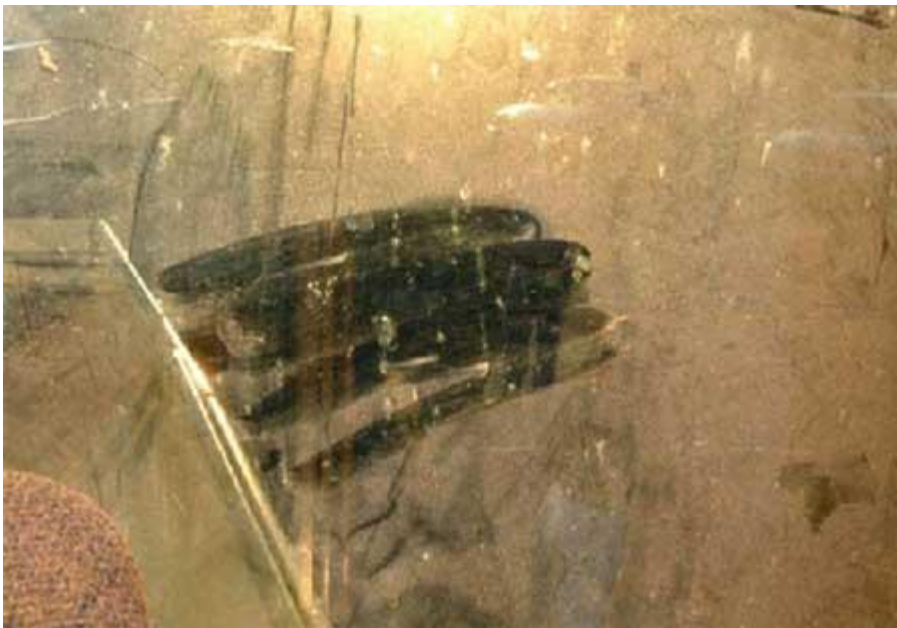
Foto 3: Esta foto muestra la vista a través de la ventana trasera desde el asiento del conductor de la motoniveladora. Parte del polvo se limpió, y si se mira cuidadosamente a través de la neblina, uno apenas puede ver a una persona parada a varios pies de distancia de la motoniveladora.