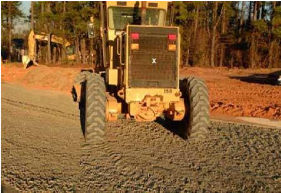
Foto 2. Esta foto muestra la parte de atrás de la motoniveladora usada en el momento del incidente. La alarma de retroceso está ubicada detrás de la parrilla y está marcada con una X.