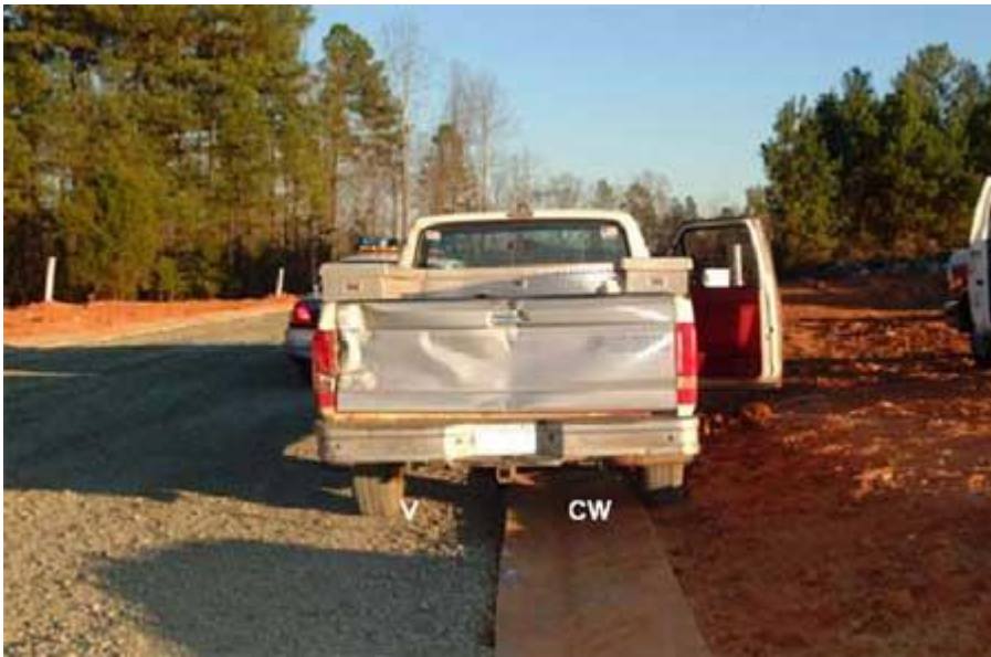
Foto 1: Esta foto muestra la ubicación aproximada de la víctima (marcada con una V) y del compañero de trabajo (marcada con CW) en el momento del incidente. La plataforma trasera de la camioneta muestra el daño causado cuando la chocó la motoniveladora.