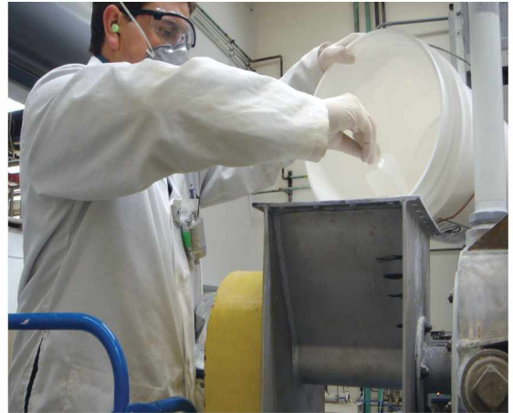
Un trabajador que labora en la producción de nanopartículas viste un equipo de protección dérmico, respiratorio y auditivo y un aparato de muestreo personal de aire durante una operación de vertimiento.

Hay diferentes tipos de nanopartículas que se producen o usan en varios procesos industriales. Para poder determinar si estas nanopartículas representan un riesgo para los trabajadores, los científicos deben conocer lo siguiente: