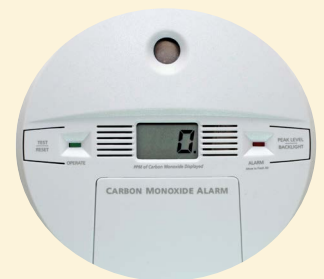
Lub twj txhom pa roj carbon monoxide