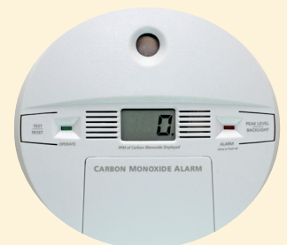
Detektè monoksid kabòn