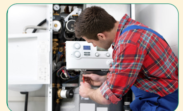
Fè yo fè sèvis nan sistèm chofaj ou chak ane