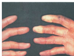
Síndrome de vibración de mano y brazo