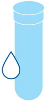
Teej in Bōtōktōk an TB

Ewōr ruo kain teej ko ñan nañinmijin TB. Kenono ibben taktō eo am kin teej ta eo emmontata ñan kwe.