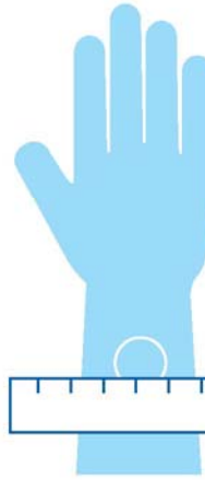
Teej in Kil ñan TB

Taktō eo am emaron rōjañ am bōk teej in bōtōktōk ñan TB kinke emaron kōmman ilo ien eo wōt, im elablok an alikar jemlok eo elañe emōj am kar bōk wā eo an TB moktalok. Teej eo ilo bōtōktōk ej joñe an jikin bōbrae eo an enbwinnim bōke kij eo ej kōmman TB.